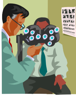
Figura 1 - Início do tratamento