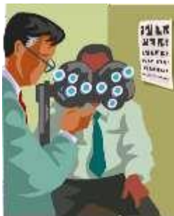
Figura 1 - Início do tratamento

Ex2: Identificar a legenda dos gráficos acima da imagem. Tamanho da Fonte 10.